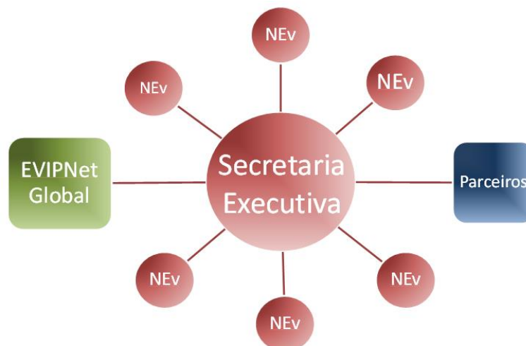
Figura 1 – Estrutura da EVIPNet Brasil.

No Brasil, as transformações sociais e econômicas que antecederam a criação do Sistema Único de Saúde (SUS), assim como, o processo de construção e consolidação do sistema, contribuíram para tornar o uso de evidências na gestão do SUS um enorme desafio. Com objetivo de estimular o uso de evidências no sistema brasileiro de saúde pública, o Departamento de Ciência e Tecnologia (Decit) da Secretaria de Ciência, Tecnologia e Insumos Estratégicos (SCTIE) do Ministério da Saúde (MS) apresentou projeto à Organização Pan-Americana da Saúde (OPAS) para adesão do Brasil à Rede para Políticas Informadas por Evidências (EVIPNet), com intuito de participar da rede colaborativa mundial ( EVIPNet Global ) para a elaboração, implementação e monitoramento de políticas informadas por evidências científicas (Fig. 1).